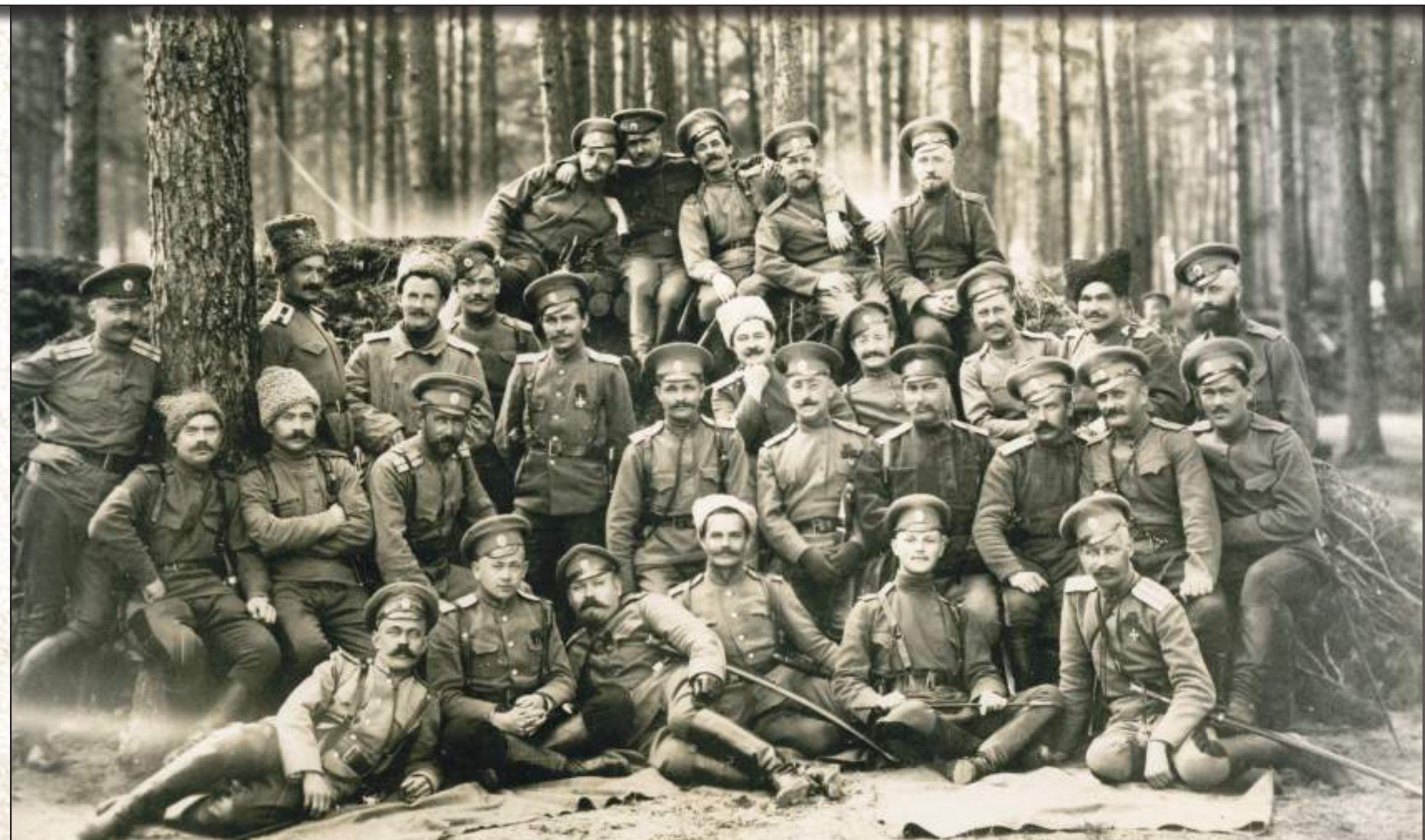
В ноябрьских и декабрьских боях 1914 года забайкальские казаки сутками не слезают с коней... На фото - группа офицеров 1-го Аргунского полка Забайкальского казачьего войска. Река Пилица. 1914 год. During the November and December 1914 battles the Transbaikal Cossacks did not dismount from their horses for days. The photo shows a group of soldiers of the 1st Argun Regiment of the Transbaikal Cossack Host. Pilitsa River (1914)

The Transbaikal Cossack Brigade included the Verkhneudinsk Regiment, the Chita Regiment, the Argun Regiment, and the Transbaikal Cossack Battery. In September of 1914 the brigade participated in the fierce fighting of the Warsaw-Ivangorod Operation (150 thousand killed on each side). Near Lutsk in Volhyn Province the brigade survived an attack by new weapons delivered by 8 airplanes. Having fought off another enemy attack, during which another "novelty" (poison gases) was used by the enemy, 500 Transbaikal soldiers perished in terrible agony.