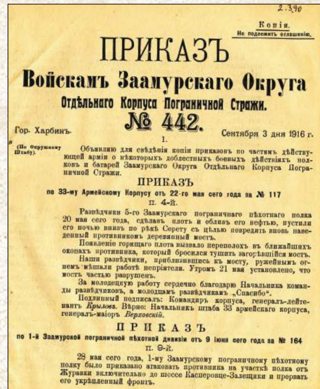
May of 1916. Приказ, изданный в Харбине, войскам Заамурского Округа Отдельного Корпуса Пограничной Стражи о доблестных боевых действиях полков и батарей во время Луцкого прорыва в мае 1916 года.