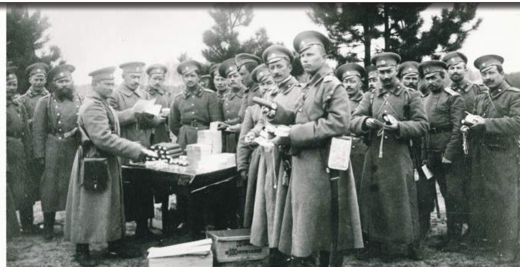
Spring 1915 1-й Читинский полк Забайкальского казачьего войска. В декабре 1914 года при отходе с левого берега реки Пилица казаки-добровольцы 1-го Читинского полка под огнем прорвались через позиции врага и вывезли на конях 30 своих раненых бойцов. На фото - раздача посылок-подарков. Весна 1915 года. The 1st Chita Regiment of the Transbaikal Cossack Host. In December of 1914, while withdrawing from the left bank of the Pilitsa River, the Cossack volunteers of the 1st Chita Regiment broke through the enemy's position under fire and evacuated on horseback 30 of their wounded fighting men. This photo shows the distribution of gift parcels