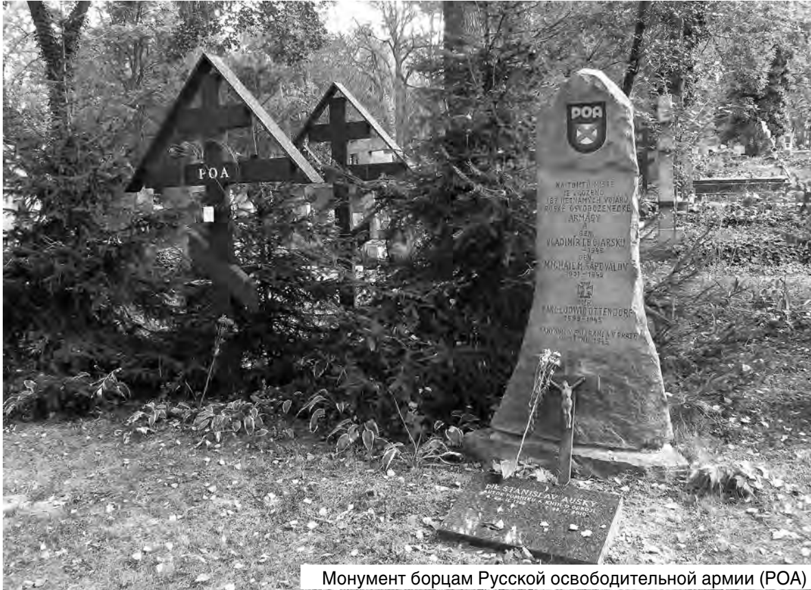
Монумент борцам Русской освободительной армии (РОА)