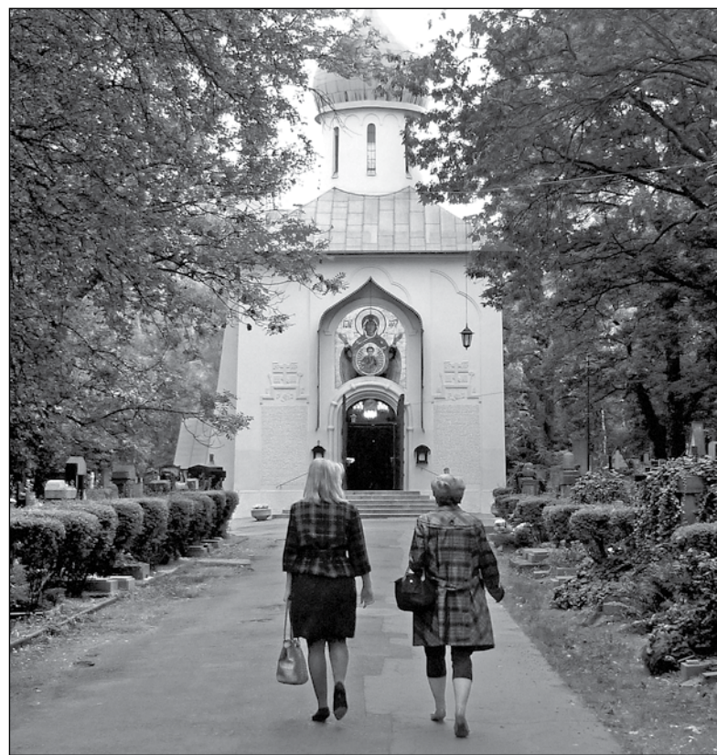
Храм Успения Пресвятой Богородицы на Ольшанском кладбище в Праге