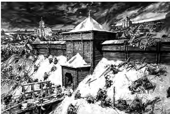
Диорама «Героическая оборона Старой Рязани от монголо-татарских войск в 1237 году» во дворце Олега, Рязань.

Но русским людям от такой скромности и сравни-