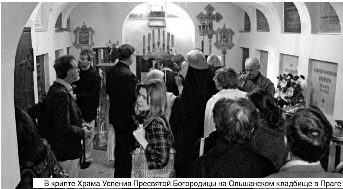
В крипте Храма Успения Пресвятой Богородицы на Ольшанском кладбище в Праге