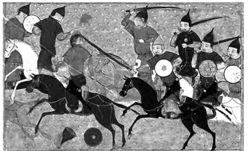
«Битва между монголами и китайцами 1211 года» из исторического сочинения «Джами ат-таварих», 1430 год