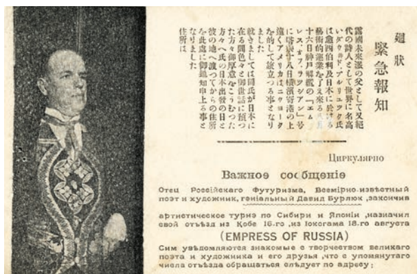
Открытка о Д.Д. Бурлюке, напечатанная в Японии.

Небольшой вулканический островок Осима 2 в 70 милях от столицы Японии поразило художников своей природой и оказалось прекрасным источником для творчества.