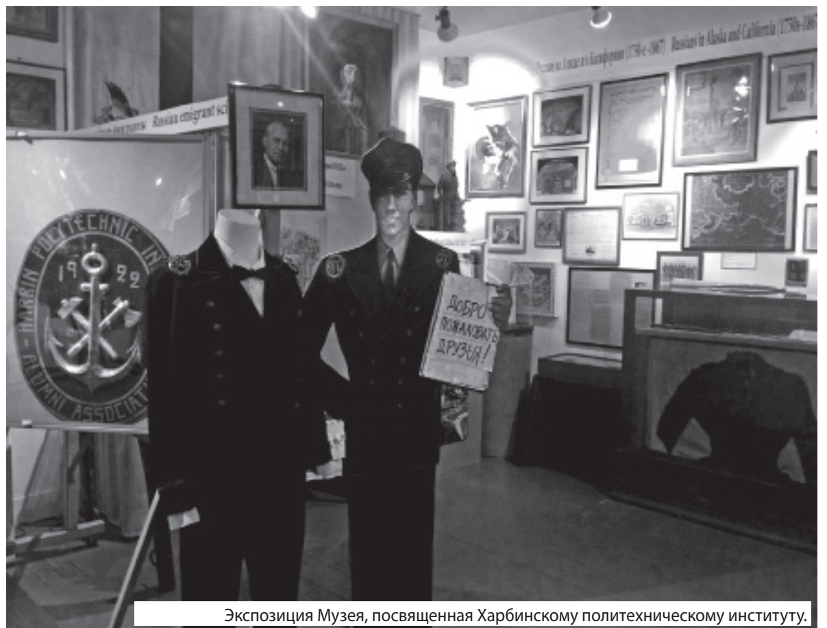
Экспозиция Музея, посвященная Харбинскому политехническому институту.

Опытный профессорско-преподавательский состав с традициями дореволюцион-