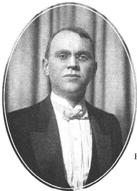
Василий Фёдорович Кибальчич. 1921 г. Париж (Comœdia illustré. 1921. № 13. P. 609).