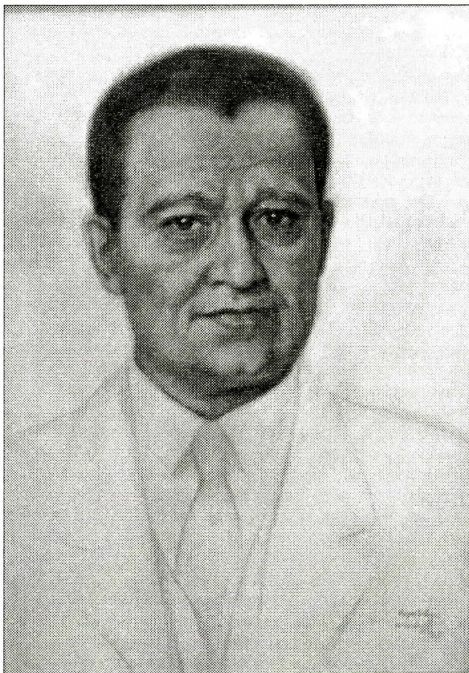
Рис. 3. Вербов М.А. Портрет гражданина Венесуэлы. Нью-Йорк. Музей русской культуры в Сан-Франциско.