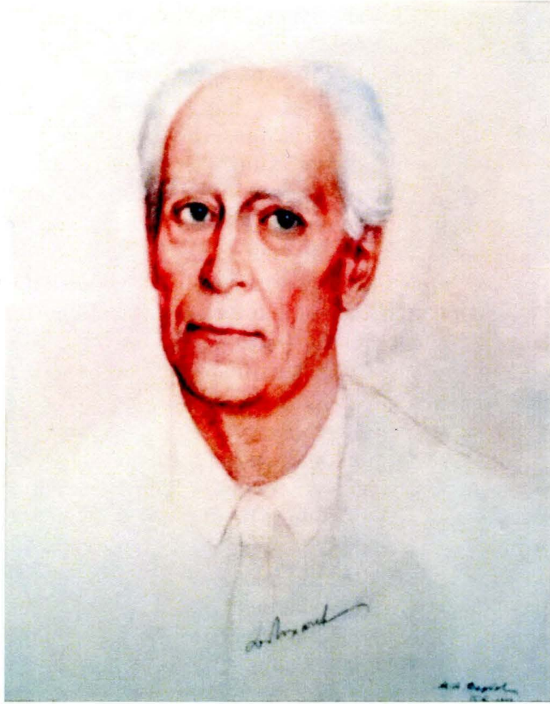
Ил. 4. Портрет академика Д. С. Лихачева работы М. А. Вербова. 1990

тельным событием. В настоящее время фотокопия этого портрета находится в кабинете Д. С. Лихачева в Институте русской литературы (Пушкинский Дом) РАН, в Санкт-Петербурге.