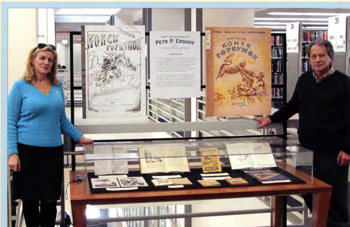
Фотография М. Н. Толстого