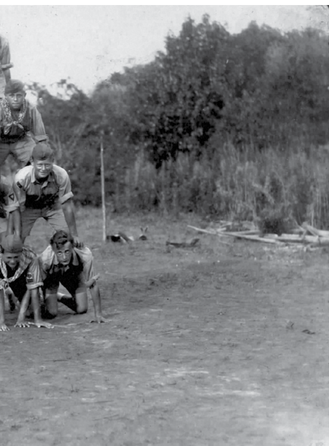
Сцены из жизни "Костровых Братьев", лето 1925 года