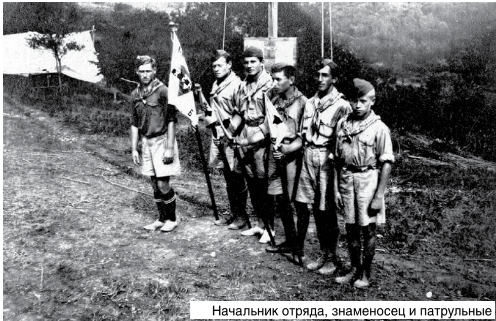
Начальник отряда, знаменосец и патрульные